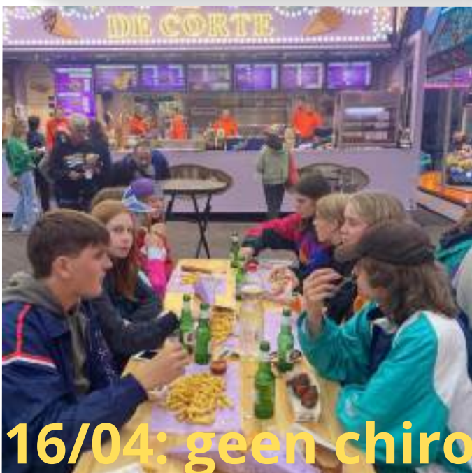
16/04: geen chiro